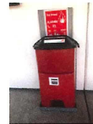
4 HÅNDSPRØJTE PÅ 1 SAL VED LEJ 406, 204, 207, 214, 216