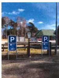
1 LADESTANDER TIL EL BILER 10 STK