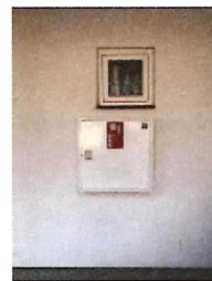
3 BRANDSLANGE I STUEPLAN VED LEJ 305, 103 112, 116